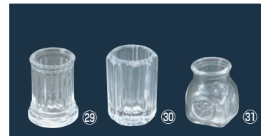
㉖ガラス 80N ようじ立 (蓋無) スキ