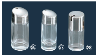
㉓ガラス #900 ようじ入れ