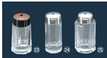
⑳ガラス 69 木目 ようじ入れ